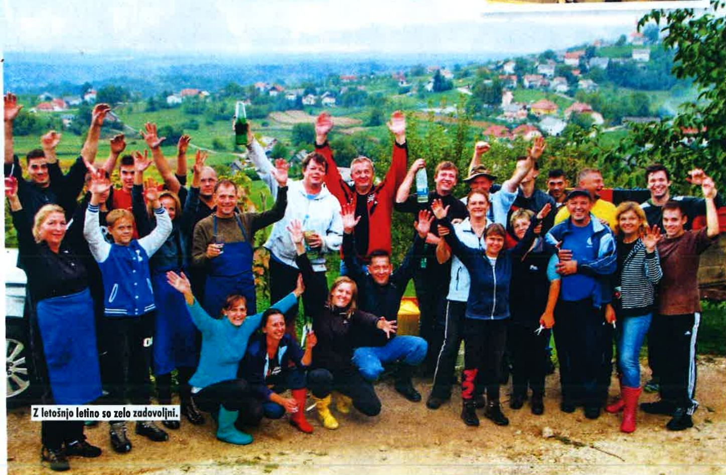
Z letošnjo letino so zelo zadovoljni.