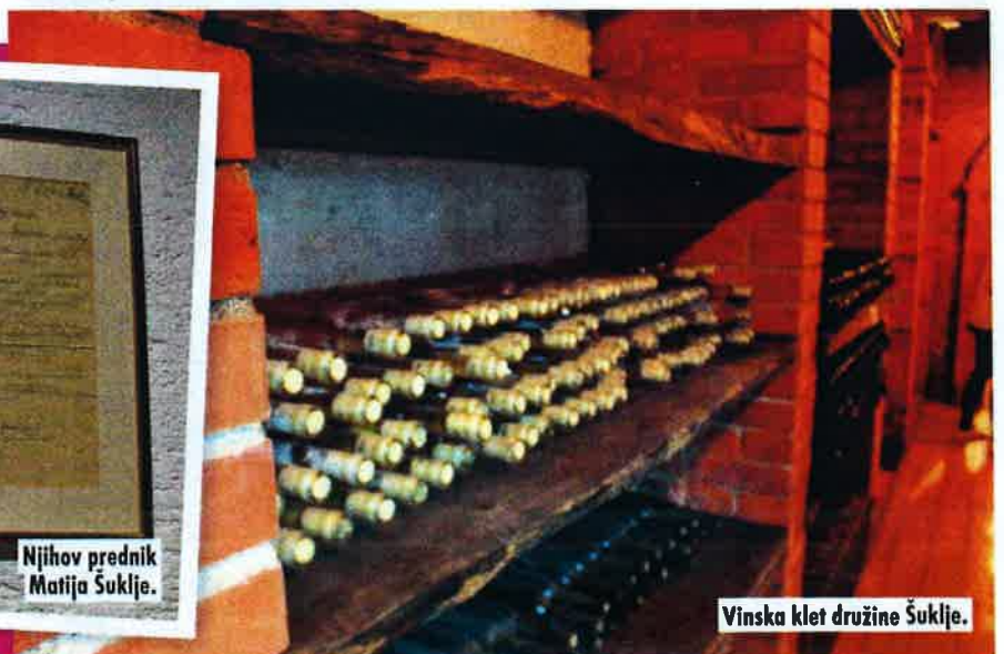
Vinska klet družine Šuklje.