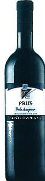
Jožef Prus Bela krajina Šentlovrenka 2013 suho