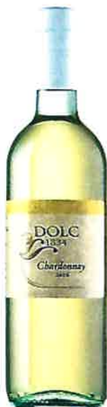
Dolc 1834 Bela krajina Chardonnay 2016 suho