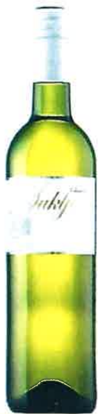
Šuklje Bela krajina Sauvignon 2015 suho

Prihodnjič? Spremljajte naša e-obvestila!