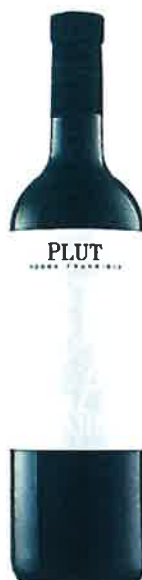
Anton Plut Bela krajina Modra frankinja 2011 suho