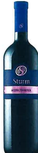
Šturm Bela krajina Modra frankinja 2011 suho