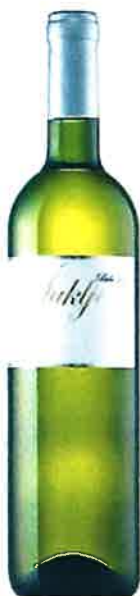
Šuklje Bela krajina Belo 140 2015 suho