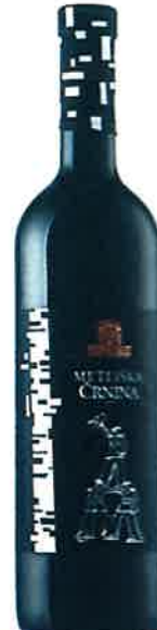
KZ Metlika Bela krajina Metliška črnina PTP 2015 suho

Poleg belokranjskega terroirja izraža tudi svojo domovino. Direkten, svež, brez odvečnih sadnih arom, samo zelišča, trave, subtilen bezeg in paprika. Zelo suho in izrazito svež. Ne je ta, že nekaj letnikov prej sauvignon, ki se spogleduje z dolino reke Loire.